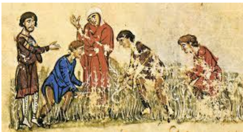
(καλλιεργεί κλήματα, αμπέλια)

Παρά το γεγονός ότι είχαν στην κατοχή τους πολλά κτήματα και ζώα λόγω της βαριάς φορολογίας αναγκάζονταν να πουλήσουν το χωράφι τους στον πιο πλούσιο γείτονα και να εργάζονται για αυτόν ως δουλολάροικοι (οικονομική εκμετάλλευση). Αυτό είχε ως συνέπεια να είναι τελικά περισσότεροι οι σκλάβοι και οι εργάτες παρά οι γεωργοί.